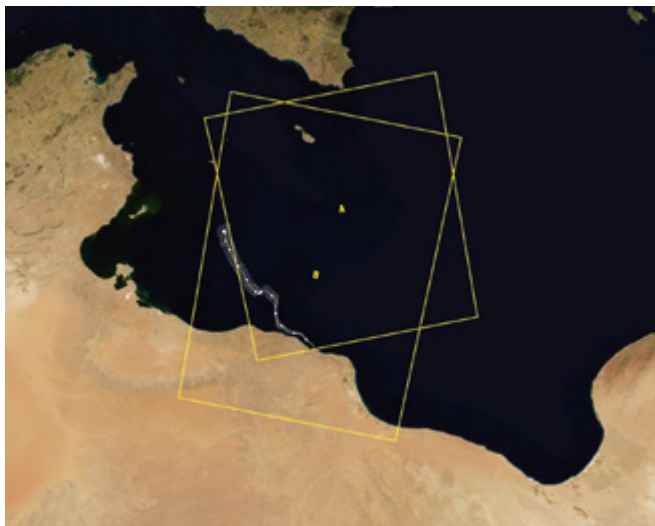
Synthetic aperture radar satellite imagery (A and B) showing the “left-to-die” boat’s drift trajectory near Lampedusa.