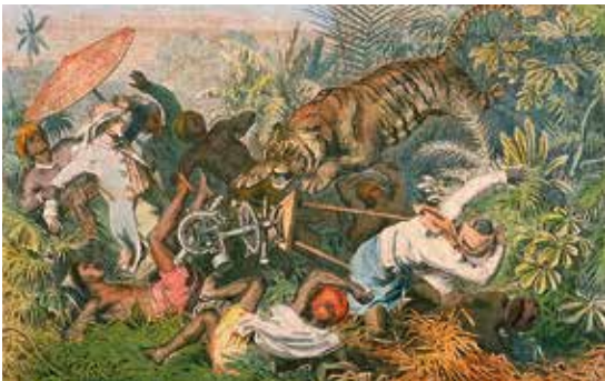
H. Leutemann, Unterbrochene Straßenmessung auf Singapur , ca. 1865–85

R: Angela Melitopoulos & Maurizio Lazzarato, 2013, 82min, OmE