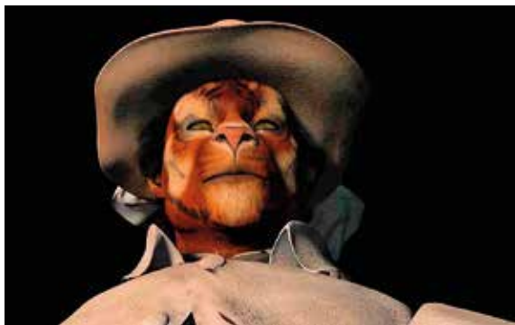
Ho Tzu Nyen, One or Several Tigers , 2017 (Filmstill)